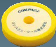
ウレタンバフ(黄) 30×150×30 21023