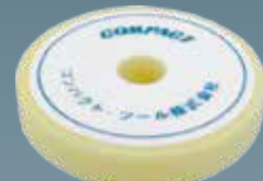
ウレタンバフフラット(白) 30×150×30 A2005