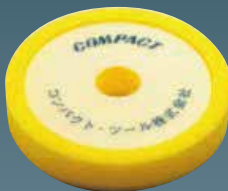
ウレタンバフ(黄) 30×150×30 21023