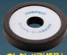
ウレタンバフ(細目) 30×150×30 21024