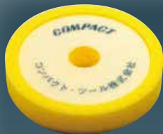
ウレタンバフ(黄) 30×150×30 21023