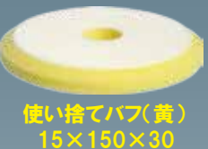
使い捨てバフ(黄) 15×150×30 A20401S