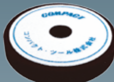
ウレタンバフフラット(細目) 30×150×30 A2007