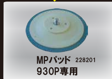
MPパッド 228201 930P専用