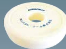
ウレタンバフ白 30×185×50 213383S