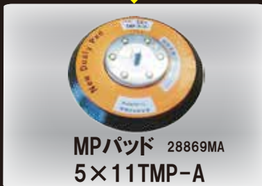
MPパッド 28869MA 5×11TMP-A