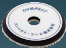
ウールテーパーバフ(黒) 10×150×30 21025S