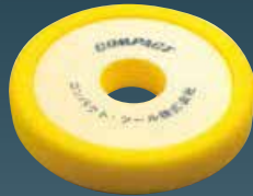
ウレタンバフ(黄) 30×185×50 213381