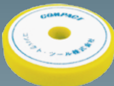
ウレタンバフフラット(黄) 30×150×30 A2006