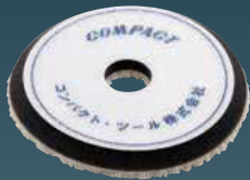
ウールファイバーバフ(黒) 10×150×30 21025S