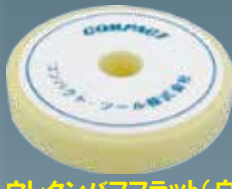
ウレタンバフフラット(白) 30×150×30 A2005