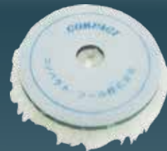
ホアバフ 30×150×30 A2120