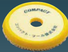
ウールバフ 20×150×30 21022S