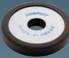
ウレタンバフ(細目) 30×150×30 21024