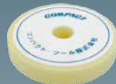
ウレタンバフフラット(白) 30×150×30 A2005