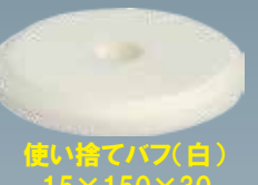
使い捨てバフ(白) 15×150×30 A20403S