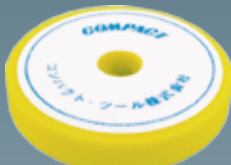
ウレタンバフフラット(黄) 30×150×30 A2006