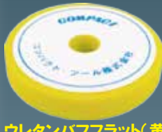
ウレタンバフフラット(黄) 30×150×30 A2006