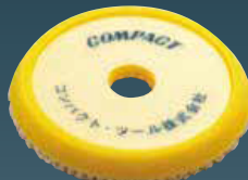
ウールバフ 20×150×30 21022S