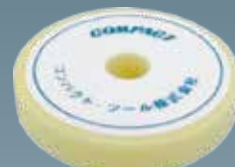
ウレタンバフフラット(白) 30×150×30 A2005