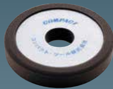
ウレタンバフ(細目) 30×185×50 213382