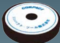
ウレタンバフフラット(細目) 30×150×30 A2007