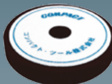
ウレタンバフフラット(細目) 30×150×30 A2007