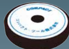
ウレタンバフフラット(細目) 30×150×30 A2007