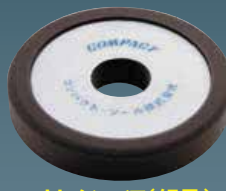
ウレタンバフ(細目) 30×150×30 21024