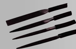
ヤスリセット 三角、丸、平、半丸 ¥5,280 (税込)