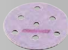
LP ベース (穴有) 5枚入り ¥5,500 (税込)