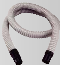
φ32 ダクトホースセット (D) ¥6,380 (税込)