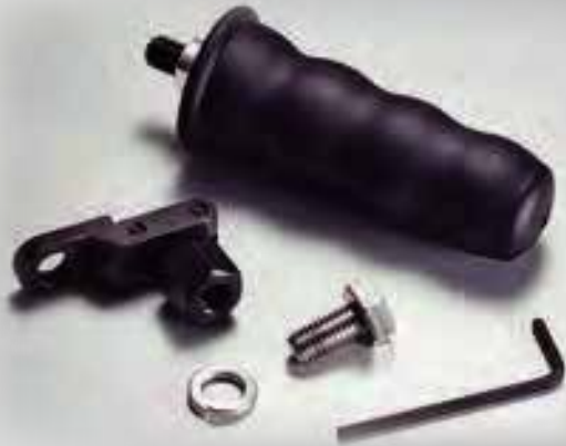
CT グリップ 定価 ¥6,578 (税込)