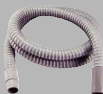
CD 用ダクトホースセット φ25-2m ¥4,400 (税込)