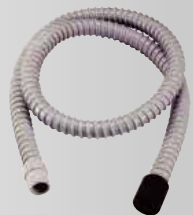
ダクトホースセット (A) φ19-1.25m ¥2,200 (税込)