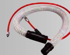
φ32 ダクトホースセット (B) ¥6,765 (税込)