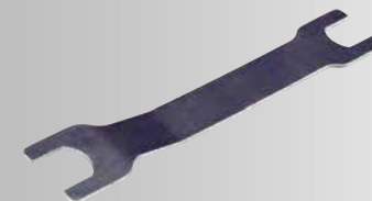
両口スパナ ¥550 (税込)