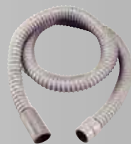
BD 用ダクトホースセット φ25-2m ¥5,720 (税込)