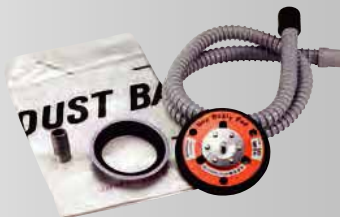
914L 用吸塵セット ¥10,450 (税込) MP 用、LP 用があります