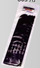
18Tノコ刃 5枚入り ¥4,400 (税込)