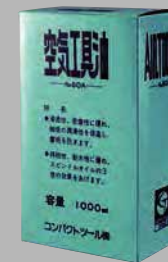
エアーツールオイル 60A-1000 ¥1,980 (税込)