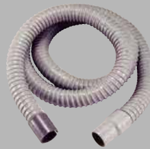
EKC-2100,2100N 用 ダクトホースセット ¥6,160 (税込)