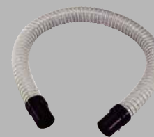
φ32 ダクトホースセット (A) ¥2,970 (税込)