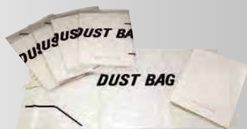
紙ダストパック 5枚入り ¥1,980 (税込)