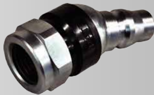
メネジフリープラグ 定価 ¥1,540 (税込)