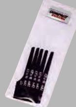
32Tノコ刃 5枚入り ¥2,200 (税込)