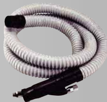
φ32 ダクトホースセット (F) ¥9,900 (税込)