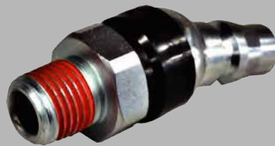
オネジフリープラグ 定価 ¥1,540 (税込)