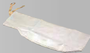
ダストパック布 ¥1,980 (税込)