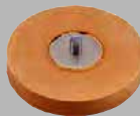
ストライプイレーサー ER-90 ¥2,200 (税込)