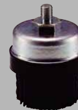
カップ型φ45 ナイロンブラシ #60/#240/#320 ¥5,500 (税込)