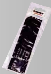
24Tノコ刃 5枚入り ¥4,400 (税込)