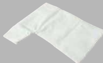
EKC-100用ダストパック ¥1,078 (税込)