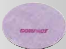
LP ベース (穴無) 5枚入り ¥5,500 (税込)