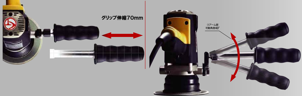
CT グリップ装着例