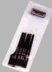
24Tノコ刃 5枚入り ¥2,200 (税込)